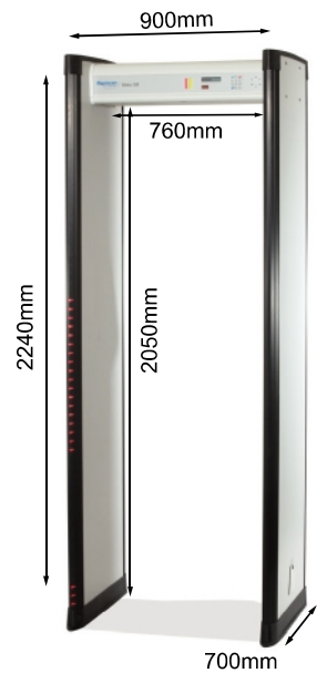
Metor 6M金属探测门整体尺寸图